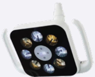
Elements of equipment

*El equipo dental puede estar sujeto a modificaciones.